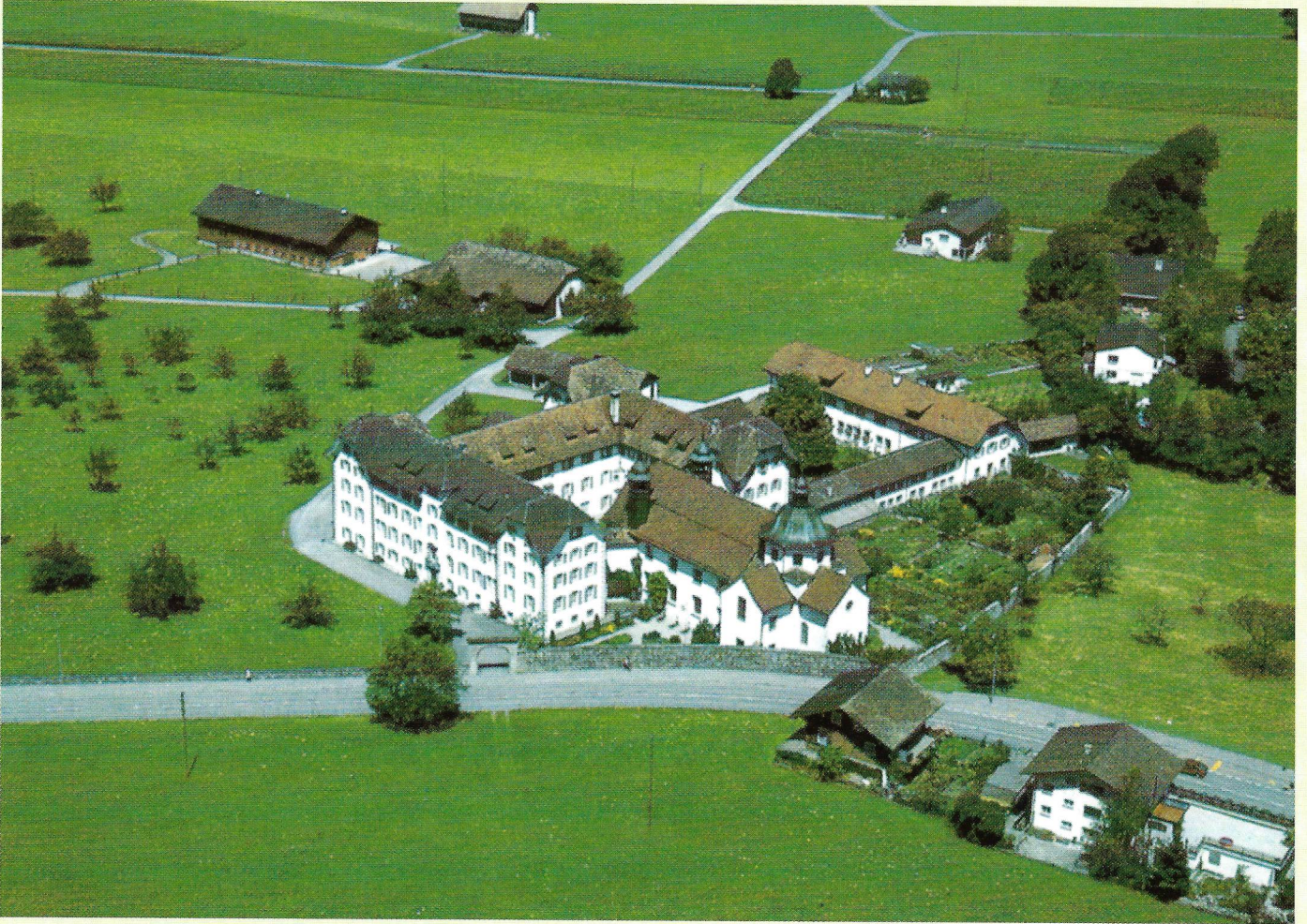
BENEDIKTINERINNEN KLOSTER ST.LAZARUS IN SEEDORF KANTON URI, SCHWEIZ